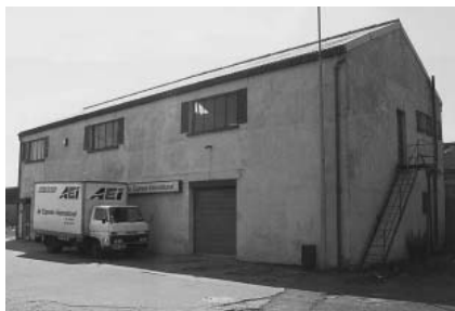
"Europazentrale", Irland 1950

Was 1958 mit einem kleinen Vertriebsbüro in Irland und einer Handvoll Mitarbeiter begann, präsentiert sich heute als Konzernbereich mit rund 2.000 Angestellten und rund 1,2 Milliarden Euro Umsatz. Mit Niederlassungen in Zentral- und Westeuropa und konstanten Wachstumsraten baute Brother seinen europäischen Unternehmenssektor über die Jahrzehnte zielgerichtet aus.