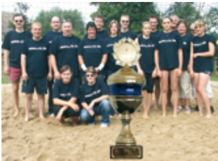
S+B-Team mit Pokal

Den „Pokal für die lustigste Mannschaft“ gewann das S+B Team beim Quelle Cup 2008. Das in Anlehnung an den Austragungsort Quellendorf benannte Beach-Volleyball Turnier wurde als privat organisiertes Sport-Event zum zweiten Mal ausgetragen. Nach Einschätzung des Veranstalters Marco Kriese erreichte man „nicht nur einen Teilnahmerecord, sondern auch ein sportlich sichtbar höheres Niveau“. Sportlicher Sieger des 2. Quelle-Cup wurde die Mannschaft Big Fun vor ZSKA Kochstedt.