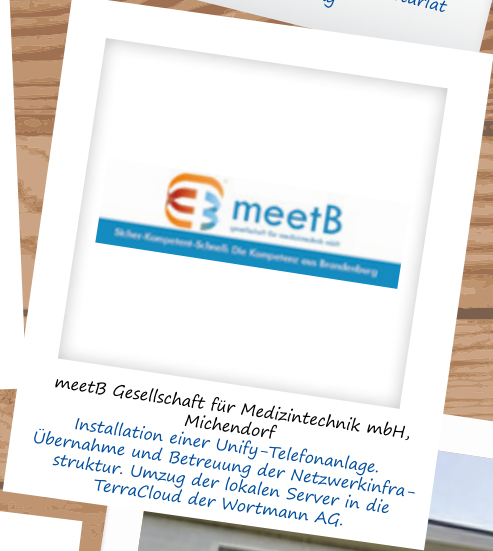
meetB Gesellschaft für Medizintechnik mbH, Michendorf Installation einer Unity-Telefonanlage. Übernahme und Betreuung der Netzwerkinfra- struktur. Umzug der lokalen Server in die TerraCloud der Wortmann AG.