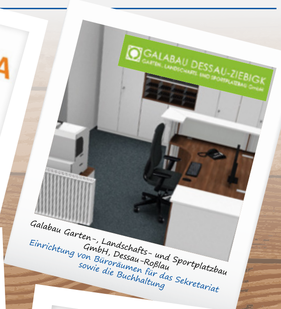
Galabau Garten-, Landschafts- und Sportplatzbau GmbH, Dessau-Roßlau Einrichtung von Büroräumen für das Sekretariat sowie die Buchhaltung