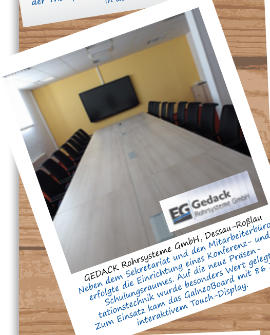
GEDACK Rohrsysteme GmbH, Dessau-Roßlau Neben dem Sekretariat und den Mitarbeiterbüros erfolgte die Einrichtung eines Konferenz- und Schulungsraumes. Auf die neue Präsen- tationstechnik wurde besonders Wert gelegt. Zum Einsatz kam das GalneoBoard mit 86 Zoll interaktivem Touch-Display.