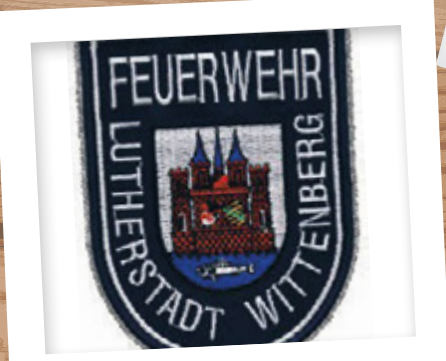
Feuerwehrlutherstadt Wittenberg Um den fleißigen Männern und Frauen mal eine Atempause zu gönnen, richtete die S+B Service und Büro GmbH den Ruheraum, den Fern- sehraum, die Büroräume, das Foyer sowie den Schulungsraum ein.