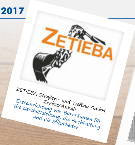
ZETIEBA Straßen- und Tiefbau GmbH, Zerbst/Anhalt Ersteinrichtung von Büroräumen für die Geschäftsleitung, die Buchhaltung und die Mitarbeiter