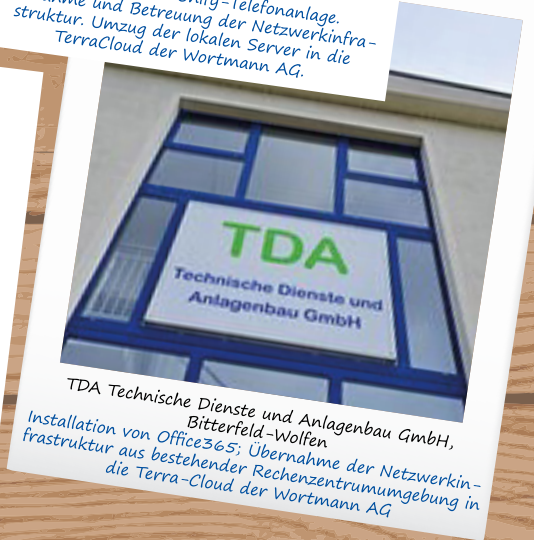
TDA Technische Dienste und Anlagenbau GmbH, Bitterfeld-Wolfen Installation von Office365; Übernahme der Netzwerkin- frastruktur aus bestehender Rechenzentrumsgebung in die Terra-Cloud der Wortmann AG