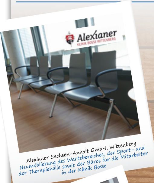
Alexianer Sachsen-Anhalt GmbH, Wittenberg Neumöblierung des Wartebereiches, der Sport- und der Therapiehalle sowie der Büros für die Mitarbeiter in der Klinik Bosse