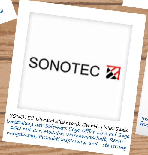
SONOTEC Ultraschallsensorik GmbH, Halle/Saale Umstellung der Software Sage Office Line auf Sage 100 mit den Modulen Warenwirtschaft, Rech- nungswesen, Produktionsplanung und -steuerung